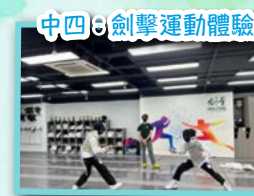
中四：劍擊運動體驗