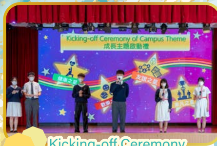
Kicking-off Ceremony of Campus Theme