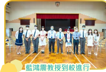
藍鴻震教授到校進行國家和社會發展講座