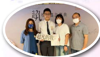
超凡學生嘉許慶典禮2022