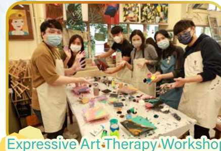
Expressive Art Therapy Workshop