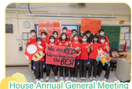
House Annual General Meeting