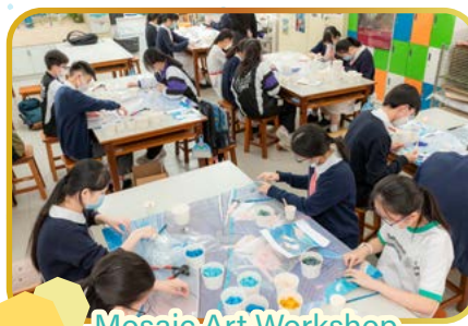
Mosaic Art Workshop