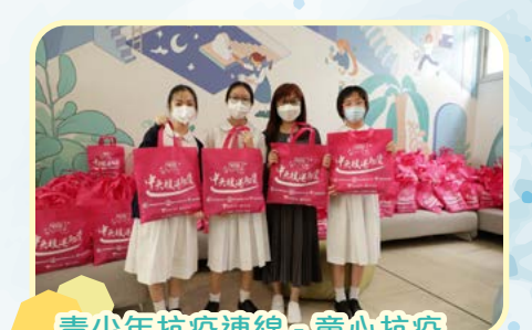
青少年抗疫連線 - 童心抗疫