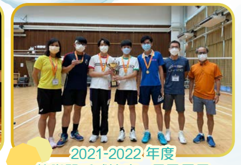
2021-2022 年度校際羽毛球比賽 - 男乙冠軍