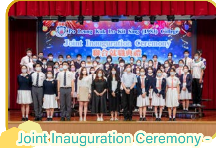
Joint Inauguration Ceremony - Prefect Team