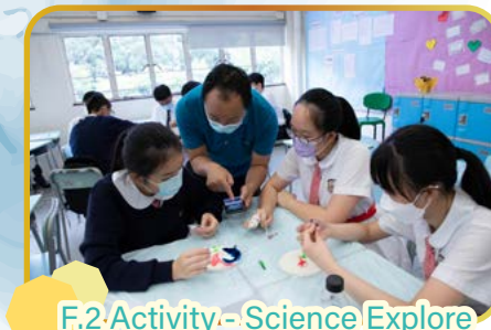
F.2 Activity - Science Explore