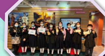
師生出席在展城館舉行的可持續發展委員會「低碳生活網上問答比賽」頒獎典禮