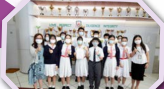
本校榮獲由香港浸會大學及香港有機資源中心舉辦的「可持續生活大挑戰短片拍攝比賽」最踴躍參與學校獎