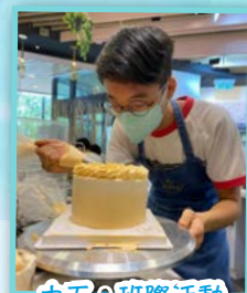
中五：班際活動 烘焙工作坊

為了加強師生之間的連繫及培養同學對班級及學校的歸屬感，本校於2022年9月16日（星期五）定為「與你同樂日」。當天，本校中一至中六同學參與各種不同的班際或級際活動以達致上述目的。