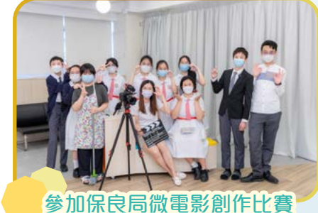
參加保良局微電影創作比賽