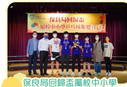
保良局回歸盃屬校中小學乒乓球錦標賽