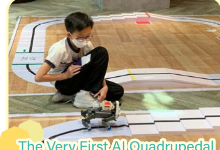
The Very First AI Quadrupedal Robot Competition