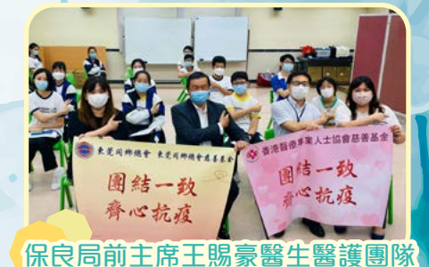
保良局前主席王賜豪醫生醫護團隊到校為學生接種科興疫苗