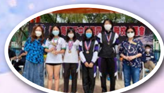
保良局屬下中學第四十屆聯校水運會