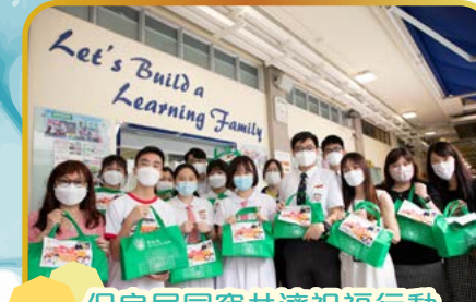
保良局同窗共濟祝福行動