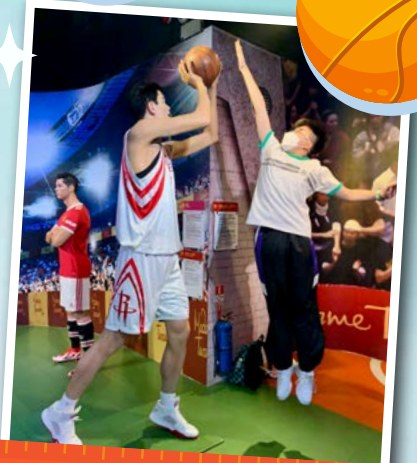
Playing Basketball with Yao Ming

In that morning, the wax museum was exclusively open for our students and teachers. Apart from exploring the exhibits in Madame Tussauds, the students also joined the 'Behind the Scene Tour' to learn about the making process of wax statues. The students took lots of pictures with the wax statues of celebrities and influential people in the world. They have also learnt more about the wax statue making. They had a wonderful and eye-opening time at the Peak.