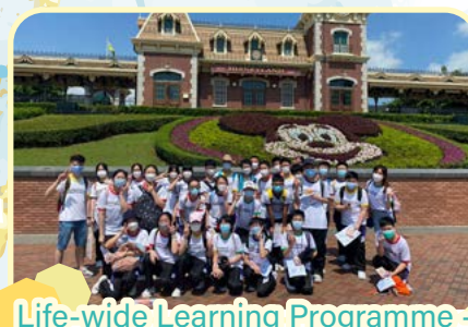
Life-wide Learning Programme - Disney Theme Park Adventure