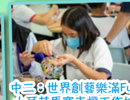
中三：世界創藝樂滿Fun 土耳其馬賽克燈工作坊