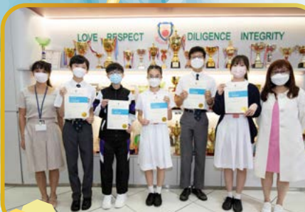
73rd Hong Kong Schools Speech Festival (English Speech)