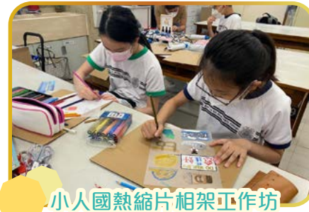
小人國熱縮片相架工作坊