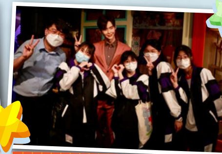
Photo with a Korean Celebrity