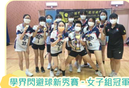
學界閃避球新秀賽 - 女子組冠軍