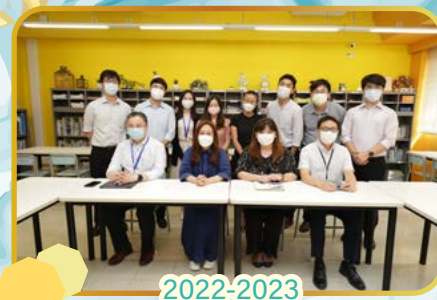
2022-2023 New Staff Orientation