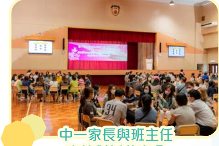
中一家長與班主任真情對話分享會