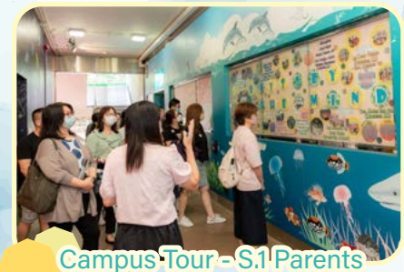
Campus Tour - S1 Parents