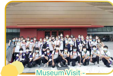
Museum Visit - Hong Kong Palace Museum