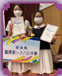
本校學生在荃葵青優秀學生選舉2021中取得優越成績