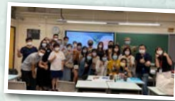
青春印記·關係增潤工作坊