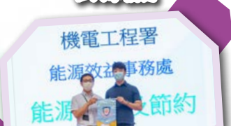
機電工程署 能源效益事務處 能源效益及節約講座 頒獎典禮