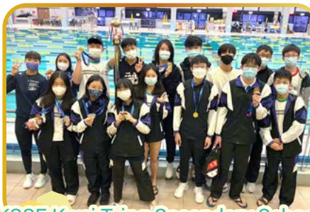
HKSSF Kwai Tsing Secondary Schools Area Committee Inter-School Swimming Competition 2022-2023