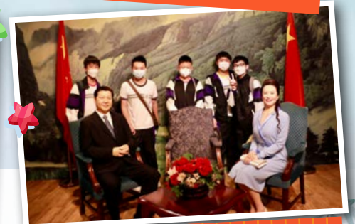
Photo with Our Premier