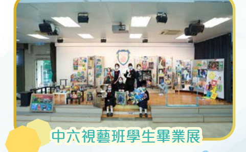
中六視藝班學生畢業展