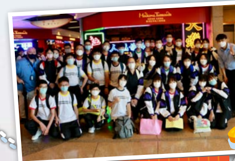
Let's Take a Group Photo